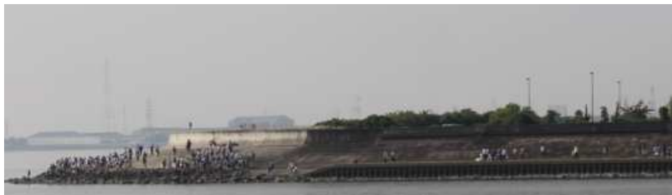
↑1,036人が参加した藤前会場、中堤会場からも多いことがわかります。

10月24日(土)に決行した第23回'15秋の藤前干潟クリーン大作戦は、市民団体の2会場には藤前会場に1,037人、中堤会場に612人の1,649人が参加。自治会会場には、775人が参加し、合わせて過去最高の2,424人が参加しました。集まったごみの量は、45Lごみ袋で2,154袋収集しました。過去最高の参加者で、官民協働・流域一帯の取組が出来たことを喜び合いたいと思います。