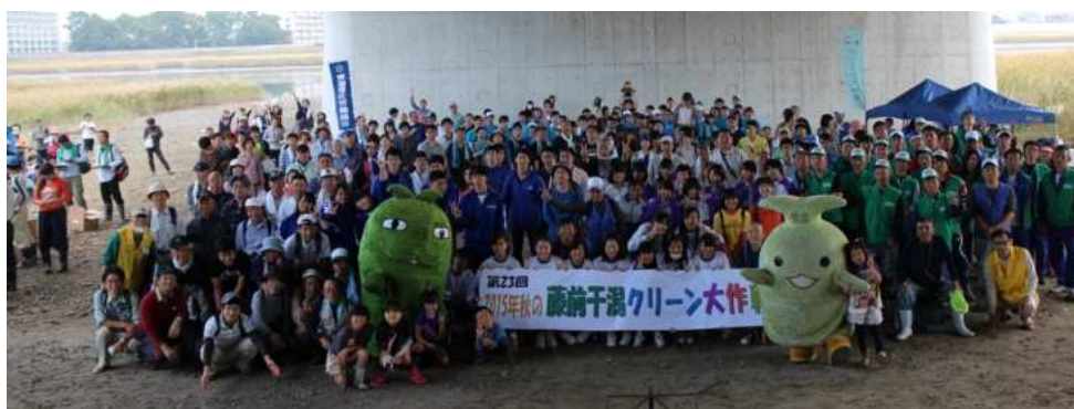
↑612人で1,041袋を収集した中堤会場・モリゾウ・キッコロと記念写真