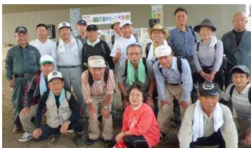
↑恵那市から22人参加

<植生・ごみ調査> 中部大学上野研究室の皆さんがヨシ原(10m*10m)の植生とごみの量を調査しました。ヨシ原にはごみが一杯あることが判明。