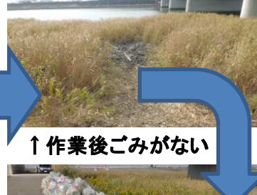
↑作業後ごみがない

<流域5地点の水質調査> 多治見市立北陵中学校生、同笠原中学校生と中部大生が、源流・中流・下流の流域5地点の水質調査をして報告。