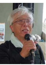
笹井三郷町 野区長挨拶