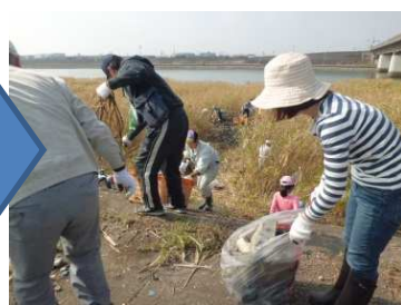
↑堤防下で拾い、引揚げて、上で分別します。