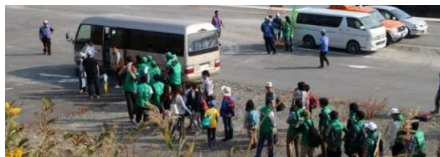
←中堤会場はマイクバスで三角から28往復して参加者を移送