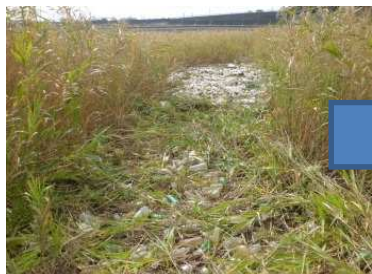
↑作業前ごみだらけの中堤