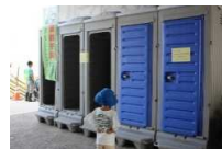
↑中堤会場2カ所に設置頂いた仮設トイレ