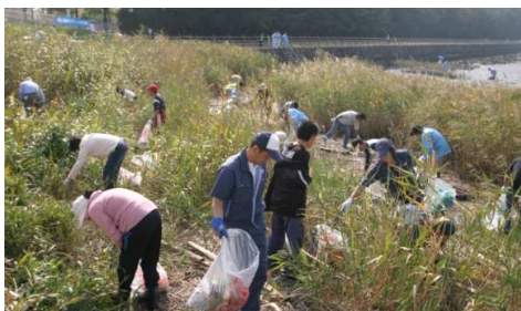
↑9カ所の自治会会場に775人参加。写真は野跡会場(213人)。