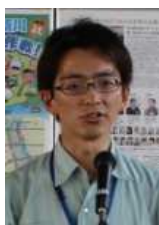
石川国交省 所長挨拶