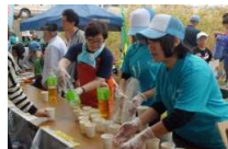
↑参加者の喉を潤した伊藤園のお茶

提供・ご協力頂きました ★大日本土木(株)(トイレ)、★(株)伊藤園名古屋西支店(お茶)、★(株)電通名鉄コミュニケーションズ(ごみ袋)、★(一社)名古屋港清港会(ゴミ袋)、★IPG(産業廃棄物専門家集団)(7ビニールグローブ)、★正色学区消防団(会場整備)、★下之一色漁業組合(駐車場)、★会場整備(国交省)提供・ご協力いただきました。ありがとうございました。